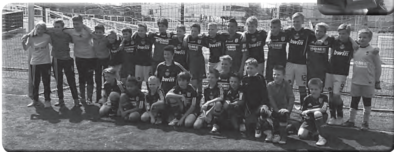
Les U 13de l'ASP avec leurs homologues Tchèques à Prague.