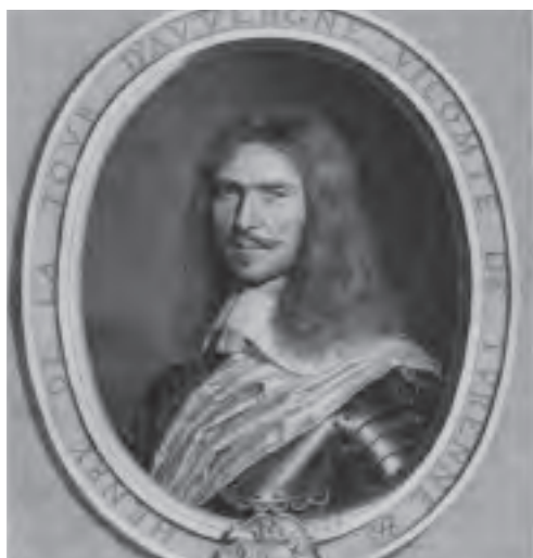
Henri de la Tour d'Auvergne, Vicomte de Turenne, Maréchal de France.