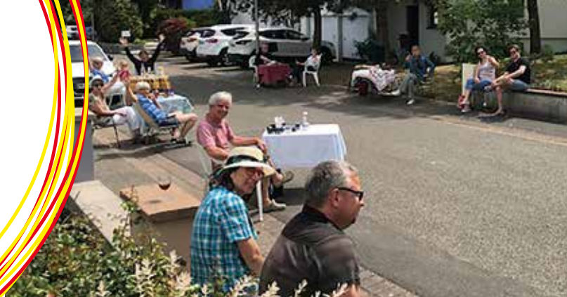
Apéro, rue de la Colline