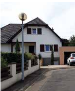
Rue des Vergers