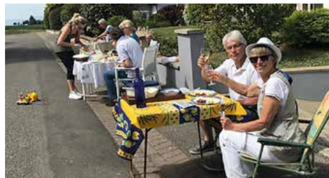
Apéro, rue de la Colline