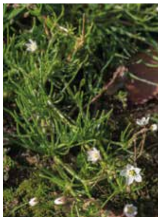
Spergule des champs